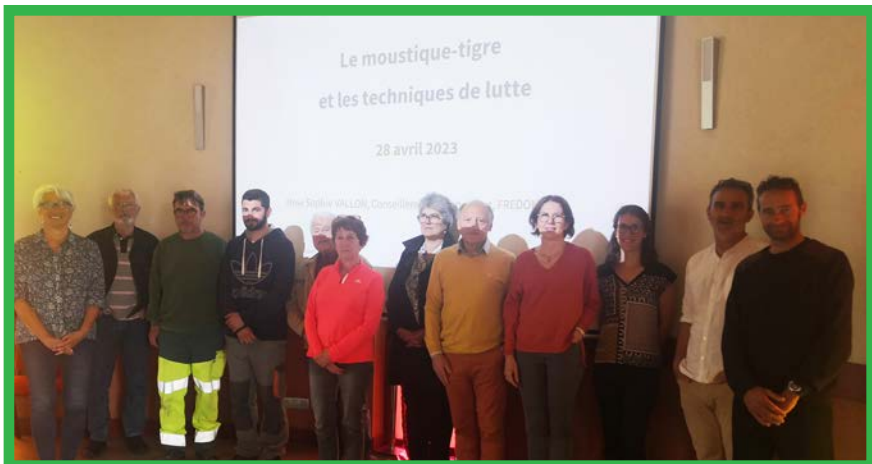
Les habitants "experts"

L'analyse de l'enquête "moustique tigre" révèle que la zone la plus infestée est le centre bourg. La densité de l'habitat en étant la cause, le "tigre" ne vole pas très loin de son lieu d'éclosion et ce d'autant plus si ce Dracula en puissance trouve sa nourriture à proximité.