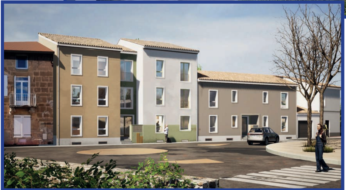
Vue depuis la place des Anciens Combattants / Illustration Drôme Aménagement habitat