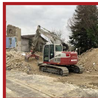
Démolition rue du Colombier