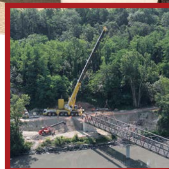
Travaux sur la passerelle