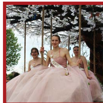
71 ème Corso, un succès

À partir du Vendredi 22 Septembre Exposition de photos "Le lien intergénérationnel" Affichage grand format sur un parcours dans le village