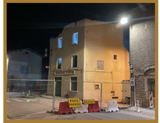
Un travail de nuit avec la RD barrée pour plus de sécurité