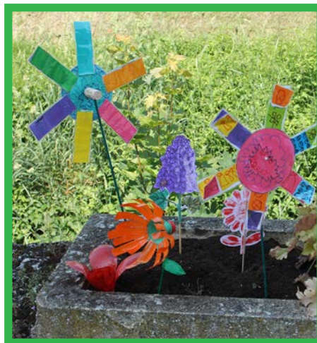
A découvrir le long de la Joyeuse.