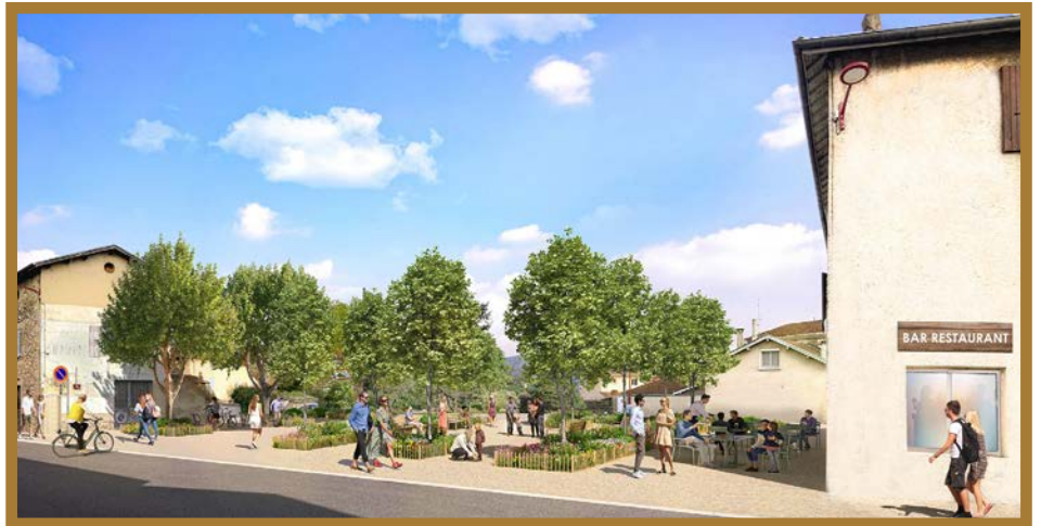
Place de la Fabrique / illustration Tangram

L'avant-projet qui avait été présenté en 2022 a été reprécisé lors de la réunion publique que 26 mai dernier. Les deux places situées de part et d'autre de la maison Arnaud vont donner lieu à des aménagements paysagers pour offrir au cœur du bourg un espace de rencontre arboré devant le café du Canon d'Or, et des places de stationnement seront recréées sur la place adjacente que nous allons baptiser lors du prochain conseil municipal. La route départementale va être aménagée avec un plateau surélevé réduisant la vitesse de 50 à 30km entre le virage de la maison Payen et l'entrée de la Rue du Moulin qui sera mise en sens unique en direction de Châtillon. La montée de la gare va être plantée d'un double alignement d'arbres, l'esplanade réaménagée, et 24