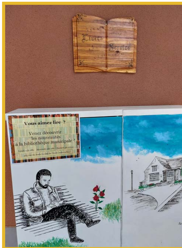
La signalétique du casier à livres