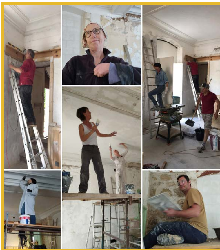
Les chantiers s'enchaînent à la chaîne. Montage photos Eric Grandin