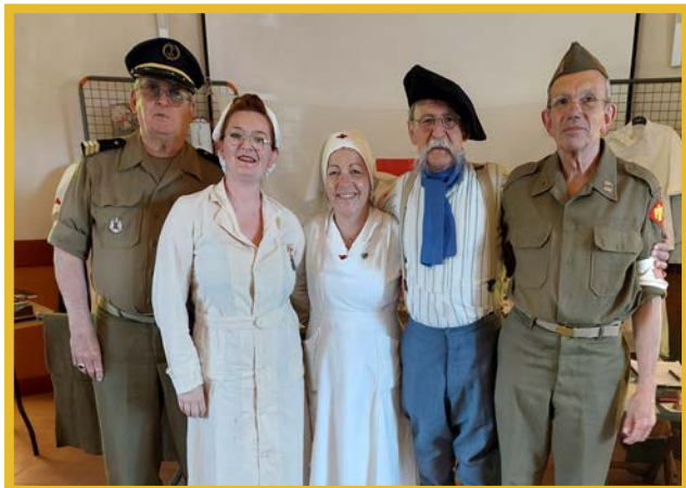
L'équipe de collectionneurs