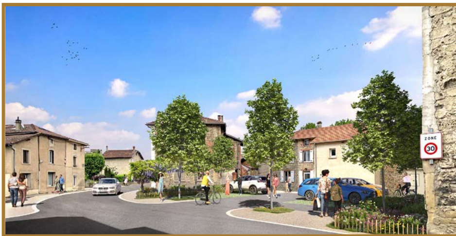
Place Claire Payen / illustration Tangram